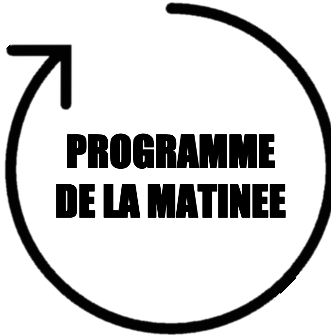
Table ronde 1 Comprendre la chaîne de valeur des solutions de communications unifiées et collaboratives, quelle proposition de valeur 9h45