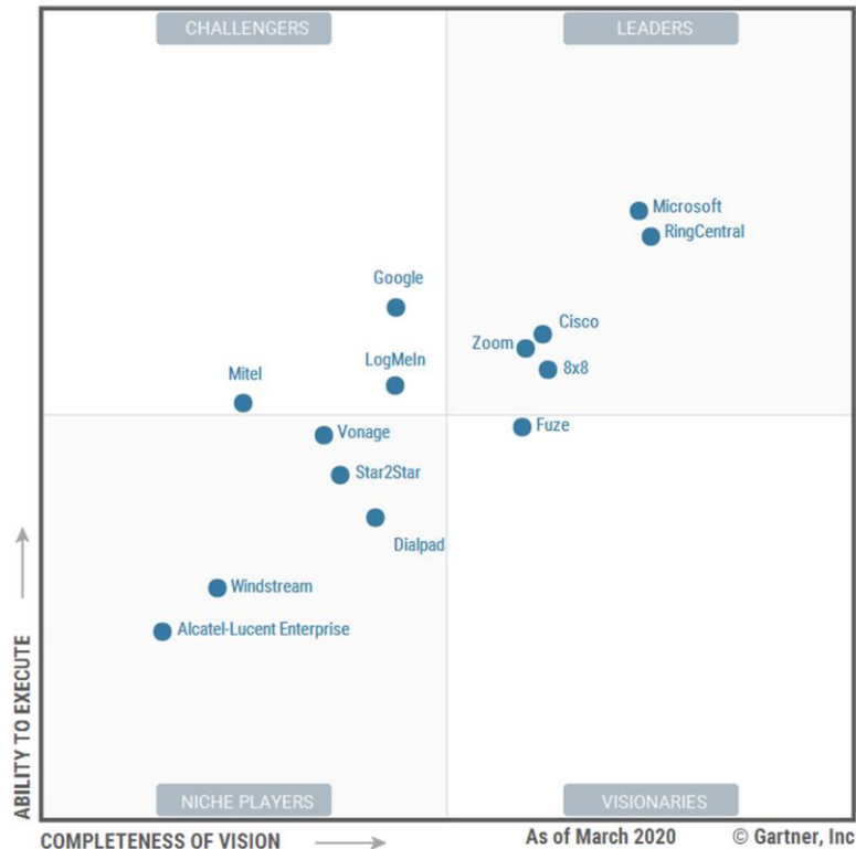
Figure 1: Magic Quadrant for Unified Communications as a Service, Worldwide

Gartner ne fait la promotion d'aucun fournisseur, produit ou service présenté dans ses publications et n'invite pas les utilisateurs à sélectionner uniquement les fournisseurs présentant les scores les plus élevés. Les publications de Gartner présentent les avis de la société et ne doivent pas être interprétées comme des faits. Gartner se décharge de toute garantie, expresse ou implicite, relative à cette étude, y compris toute garantie de qualité marchande ou d'adéquation à un usage particulier. Gartner, Magic Quadrant pour les Communications Unifiées en Tant que Service, Monde, 11 Novembre 2020, Rafael Benitez, Megan Fernandez, Daniel O'Connell, Christopher Trueman, Pankil Sheth. GARTNER est une marque déposée et une marque de service de Gartner, Inc. et/ou de ses filiales aux États-Unis et dans le monde, et est utilisée ici avec autorisation. Tous droits réservés.